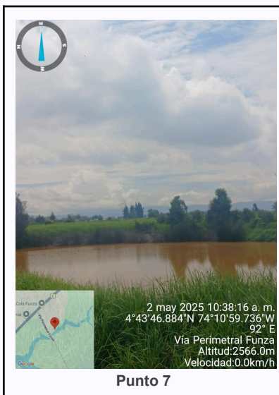
Ilustración 2. Fotos de los puntos del Recorrido de Control Y Vigilancia Ronda Del Humedal Gualí..

C.P 250020 Tel. (601) 8234070 823 40 71 / 823 40 73 Fax. (601) 8257620 Dir. Cra. 14 No. 13-05 03-FR-17 VER.10.2024